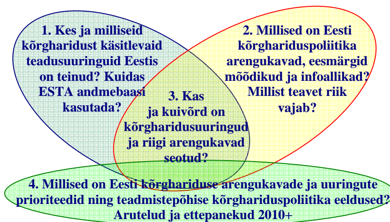
Joonis 1: Projekti uurimisküsimused

Euroopa Sotsiaalfondist rahastatud SA Archimedes kõrghariduse kvaliteedi programmi Primus projekti „Rakenduslikud interdistsiplinaarsed haridusuuringud ja andmebaasid teadmistepõhise hariduspoliitika ning majanduse teenistuses“ idee sündis vajadusest aidata kaasa programmi eesmärkide 1 ja Eestis teadmistepõhise poliitika kujundamisele. Projekti uurimisküsimused võtab tegevusetappide lõikes kokku joonis 1.